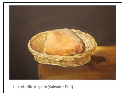
La corbeille de pain (Salvador Dalí)

Il fit de même pour la coupe, après le repas, en disant « Cette coupe est la nouvelle Alliance en mon sang ; faites cela, toutes les fois que vous en boirez, en mémoire de moi. » Car toutes les fois que vous mangez ce pain et que vous buvez cette coupe, vous annoncez la mort du Seigneur, jusqu'à ce qu'il vienne. »