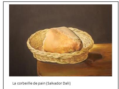
La corbeille de pain (Salvador Dalí)

Il fit de même pour la coupe, après le repas, en disant « Cette coupe est la nouvelle Alliance en mon sang ; faites cela, toutes les fois que vous en boirez, en mémoire de moi. » Car toutes les fois que vous mangez ce pain et que vous buvez cette coupe, vous annoncez la mort du Seigneur, jusqu'à ce qu'il vienne. »